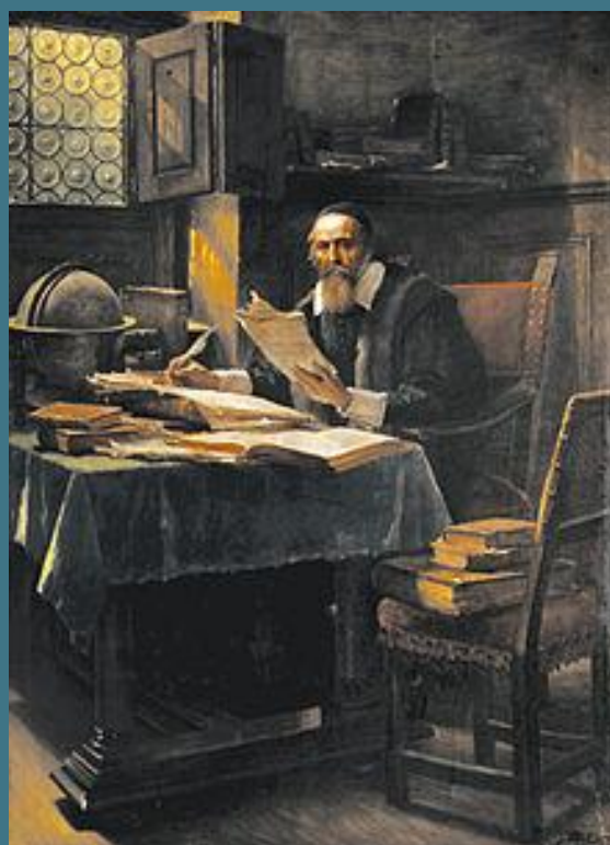
Komenský na obraze Václava Brožíka z roku 1891